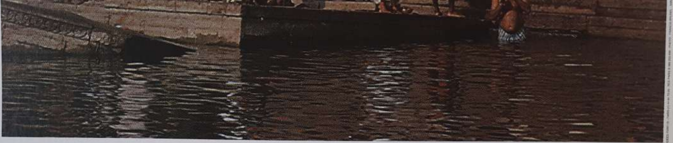
le Gange, VARANASI